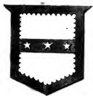
Mure of Caldwell.